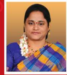
International Best Choreography Awardee (Classical Dance)