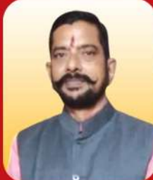
Sri Krishna Bhagavan ji Vijayawada