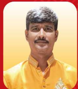
Sri B. Hari Krishna ji Swadesi Jagaran Munch