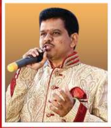
Founder & Chairman

A magnificent program has been conceptualized—unprecedented in the history of the world that seamlessly blends Vedic and Sanatana principles. This unique event centers around the worship of Lord Sri Venkateswara Swamy the manifest deity of the Kali Yuga—at Tirumala; while 18 distinct forms of traditional services are being performed directly, approximately 155 students from the Sri Radha Krishna Kalakshetram will enchant the audience with dance performances set to 108 *Annamacharya Kirtanas*.