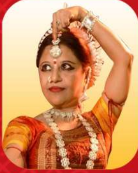
Bidushi Monalisa Ghosh Internationally Famed Odissi Exponent